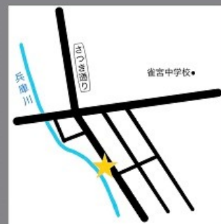
▲物件番号：5 (約 40.44 坪)