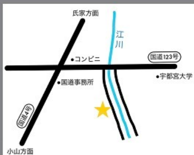
▲物件番号：3 (約 78.51 坪)