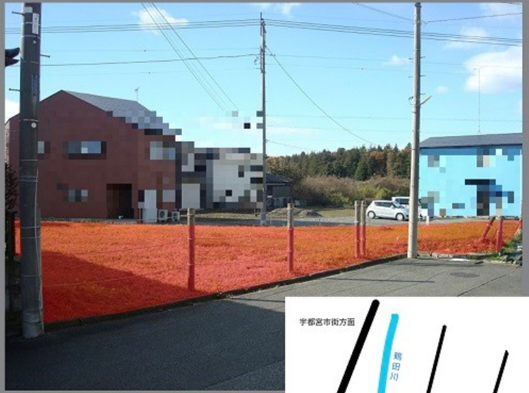
▲物件番号：2 (約 56.74 坪) 姿川地区市民センターの そばに位置しています。