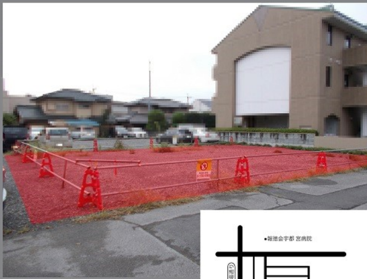
▲物件番号：1 (約 77.07 坪) 栃木県立がんセンター西側 住宅地の一角に位置して います。